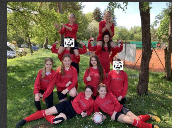
Schulmannschaft WK IV - Schuljahr 21/22